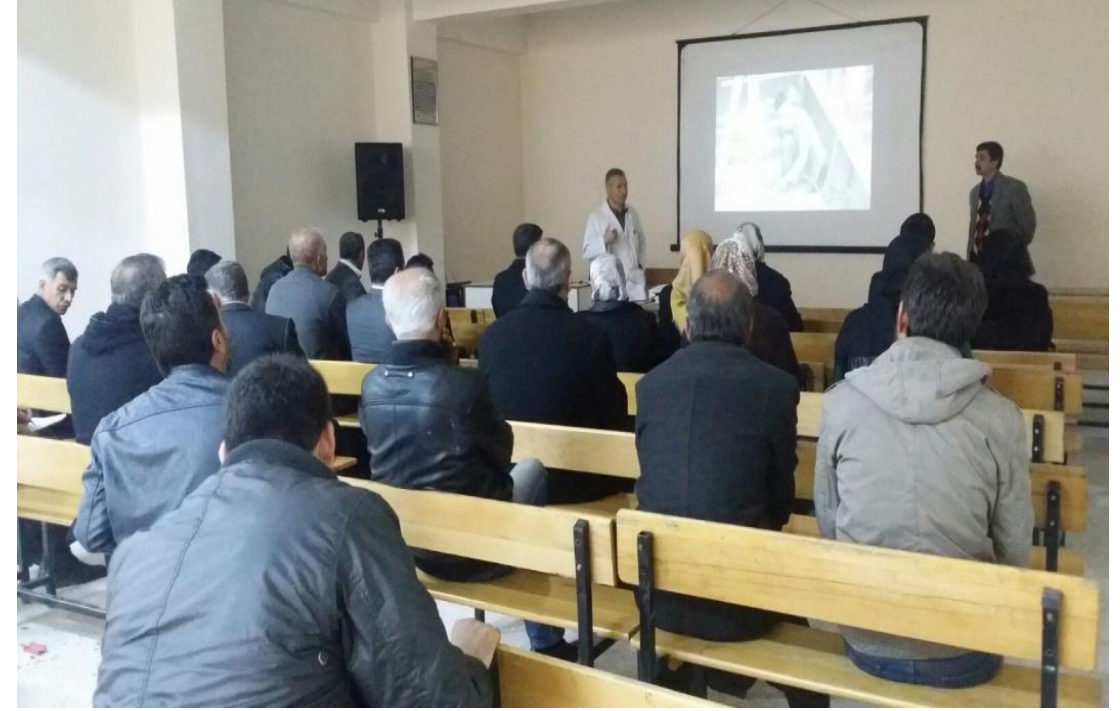
İş Güvenliği Eğitimleri