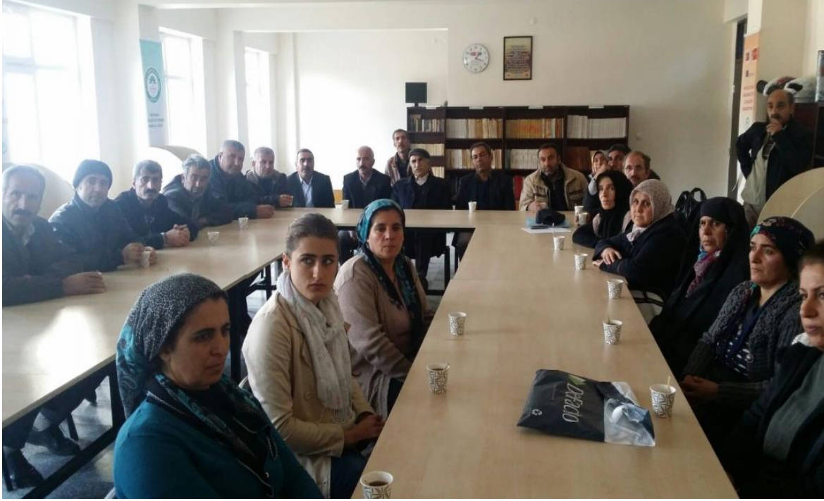
Düzenli Veli Toplantıları