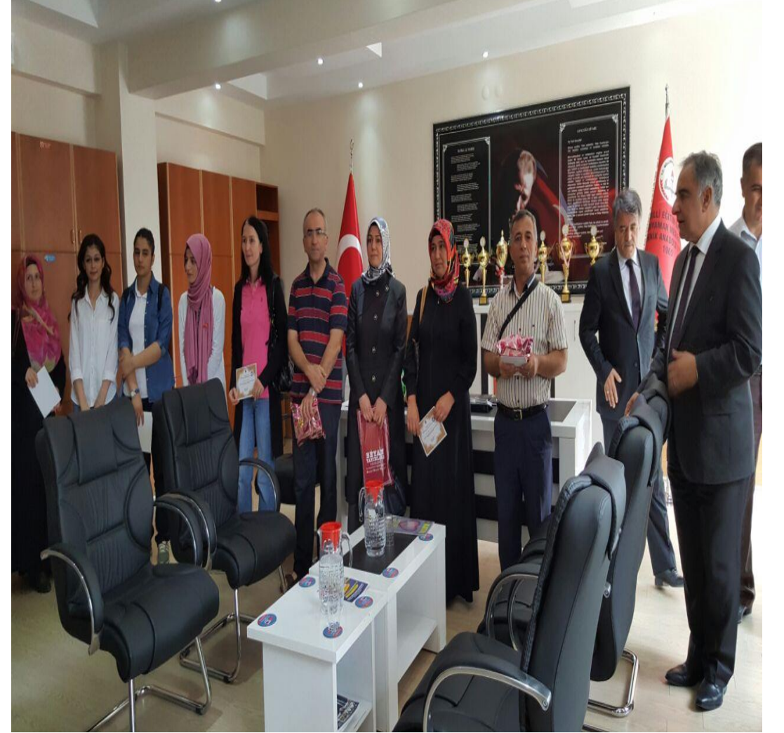
“Veliler Okuyor” Ödüllü Kitap Okuma Yarışması