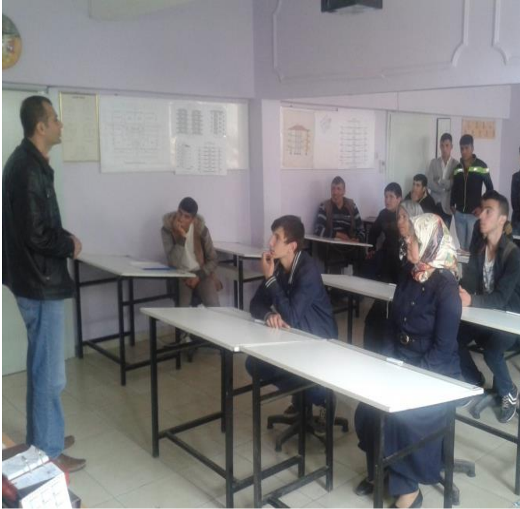
Alan Tanıtım Toplantıları